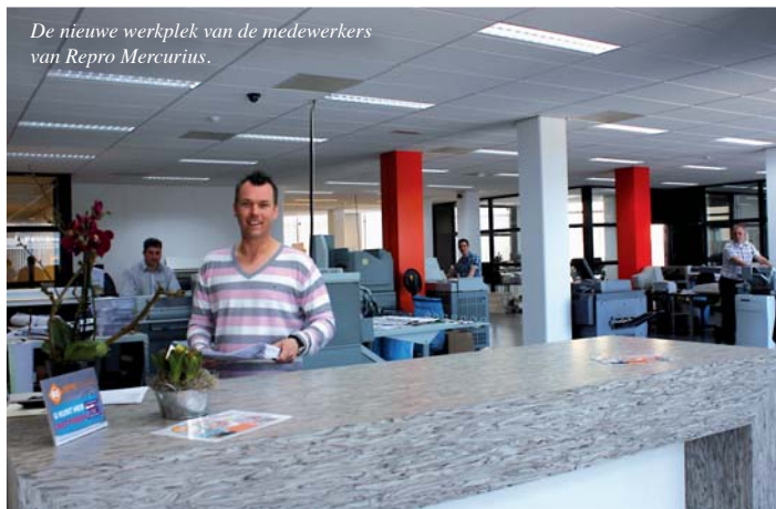
De nieuwe werkplek van de medewerkers van Repro Mercurius.